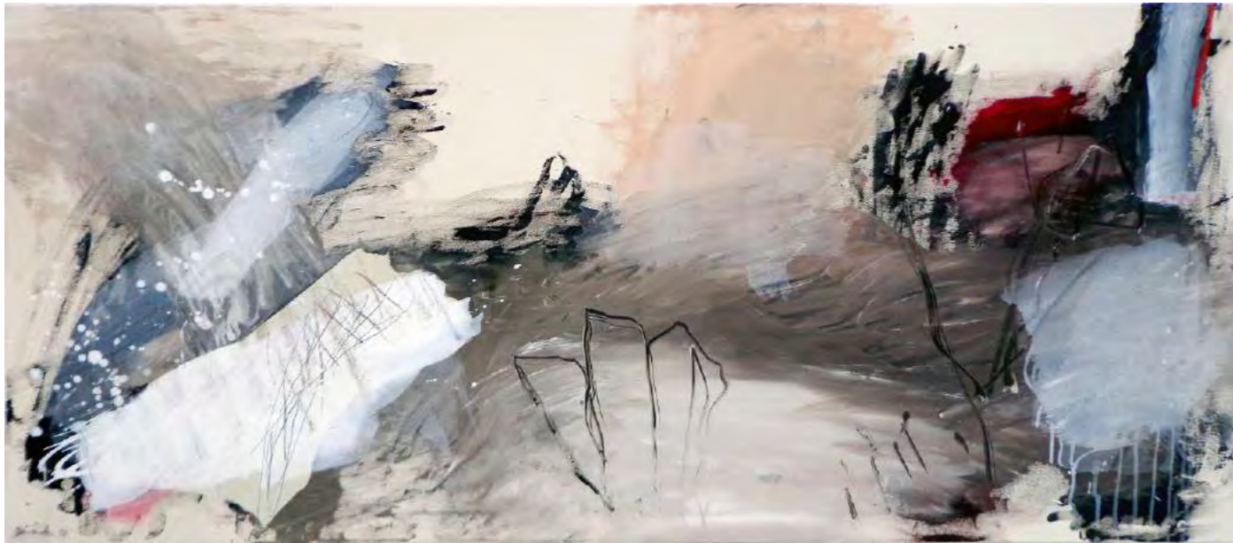
10 Jazz at work, 2021, Acrylique, huile, collage, graphite s/ toile, 70 x 160 cm