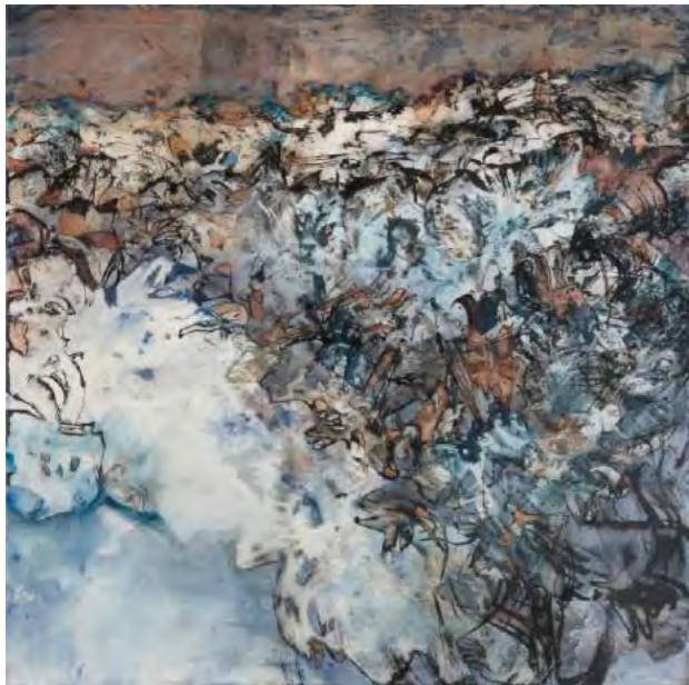
4 Mobile-Immuable IV, 2018, Encre de chine et acrylique s/ toile, 100 x 100 cm