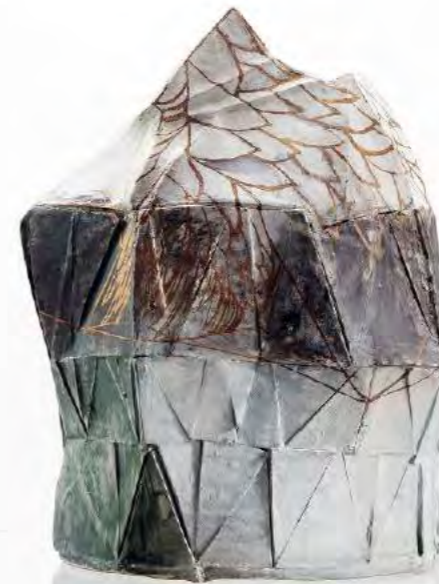
> Golden Rock10, 2019 Céramique, grès, engobes, lustres, 36 x 36 x 36 cm