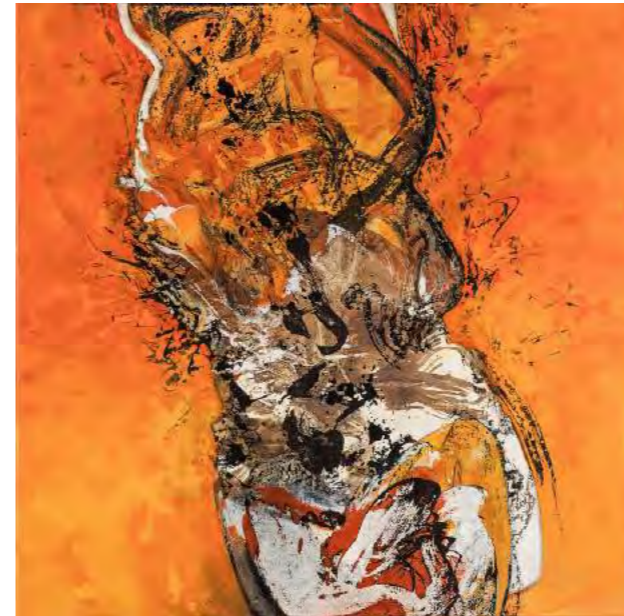
Duo ou duel ?, 2017, Encre de chine et acrylique s/ toile, 100 x 100 cm