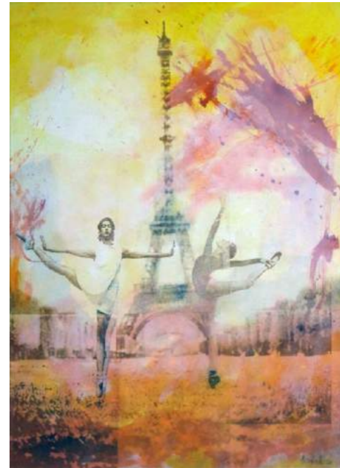
Traît d'esprit, 2020, Gumprint, acrylique s/ toile, 110 x 85 cm