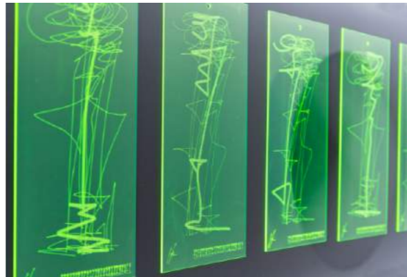
« always shine on me », 2020, Acrylique lumineuse, 40 x 20 cm