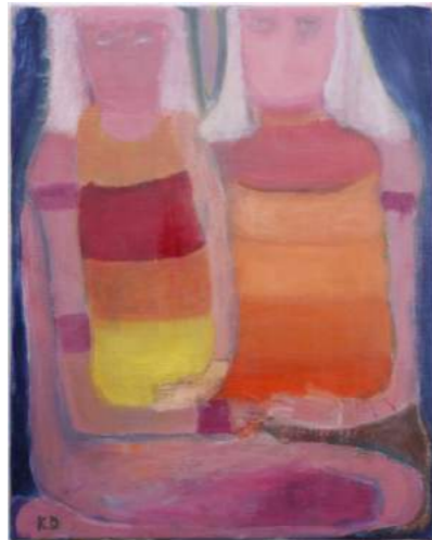
<< multiple hands, 2021 Huile s/ toile, 80 x 80 cm