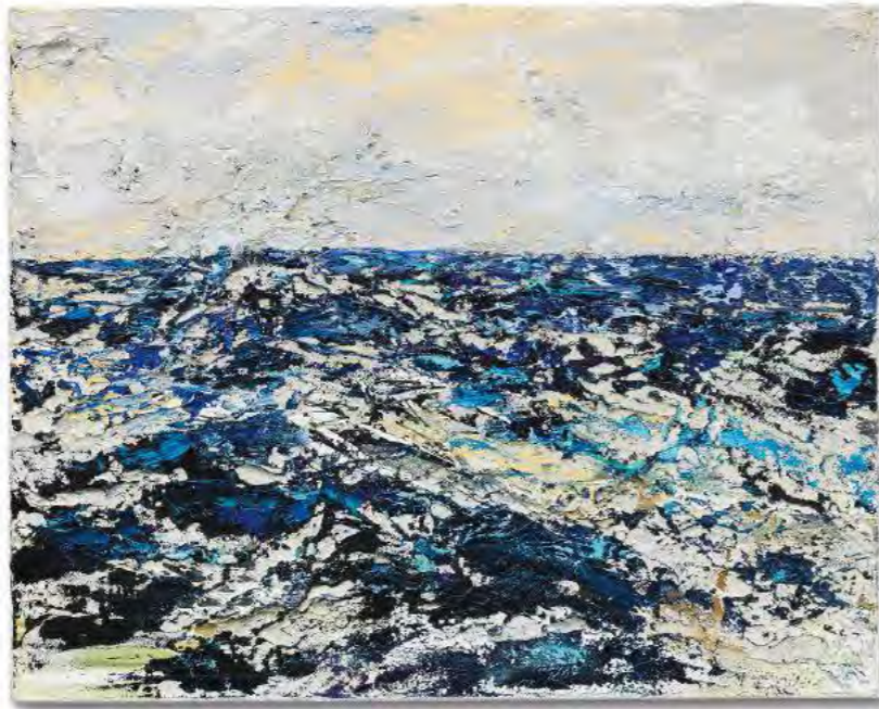
>> Stranddünen, 2019 Huile s/ bois entoilé, 40 x 40 cm