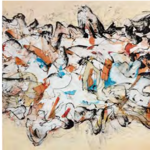
Traces XIX, 2019, Encre de chine et acrylique s/ toile, 80 x 80 cm